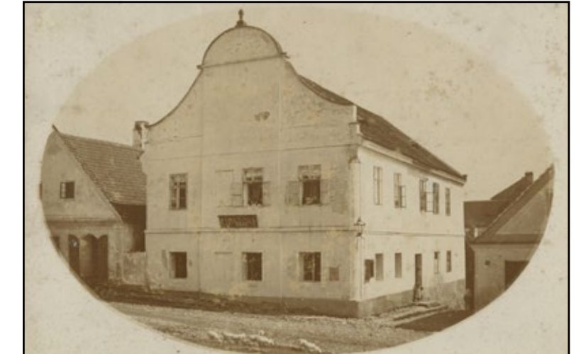
Na fotografii Čeika Habarta je budova „staré“ školy na borotínském rynku, kterou navštěvoval i Jan Evangelista Kypta. Dnes je v této budově radnice, knihovna a pošta. Fotografie z přelomu 19. a 20. století.

Partneři: Společenství obcí Čertovo břemeno a Městy Borotín