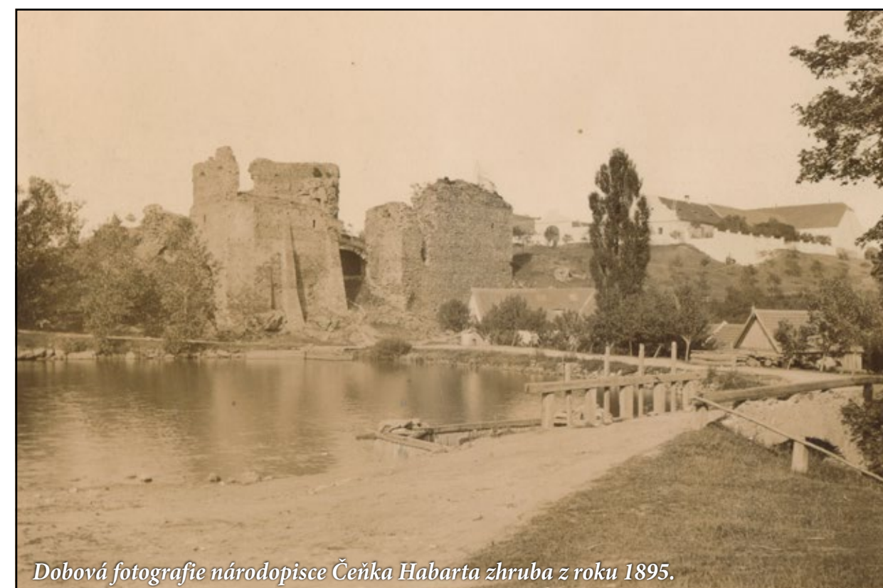
Dobová fotografie národopisce Čenka Habarta zhruba z roku 1895.