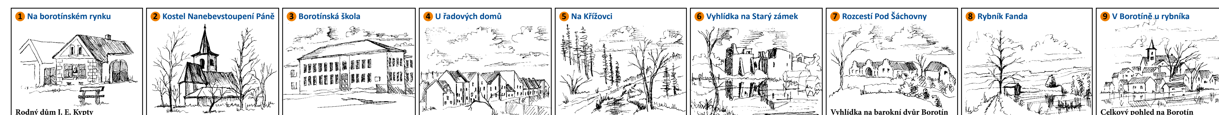
1 Na borotínském rynku

gelisty Kypty, na budově školy zase pamětní deska borotínských rodáků, bratrů Cikhartových, významných národopisných pracovníků a regionálních historiků. Na nedaleké zřícenině hradu je umístěna pamětní deska připomínající návštěvu básníka Karla Hynka Máchy v roce 1829. Po letech chátrání se na lepší časy blýská baroknímu statku naproti zřícenině hradu, který se v roce 2010 začal postupně rekonstruovat.