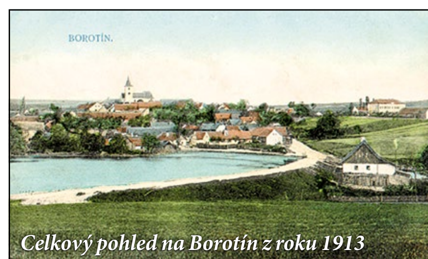
Celkový pohled na Borotín z roku 1913

Naprostou zkázu znamenala pro Borotín třicetiletá válka. Nejen Borotín, ale i celé široké okolí byly několikrát vypáleny a vypleněny. Opuštěn byl i hrad, který v době obléhání Tábora, koncem roku 1620, vypálilo císařské vojsko.